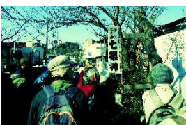
⑥ 宝戒寺(毘沙門天) 七福神めぐりウォークスタンプ帳