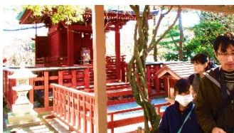
⑦ 鎌倉八幡宮(旗上弁財天)